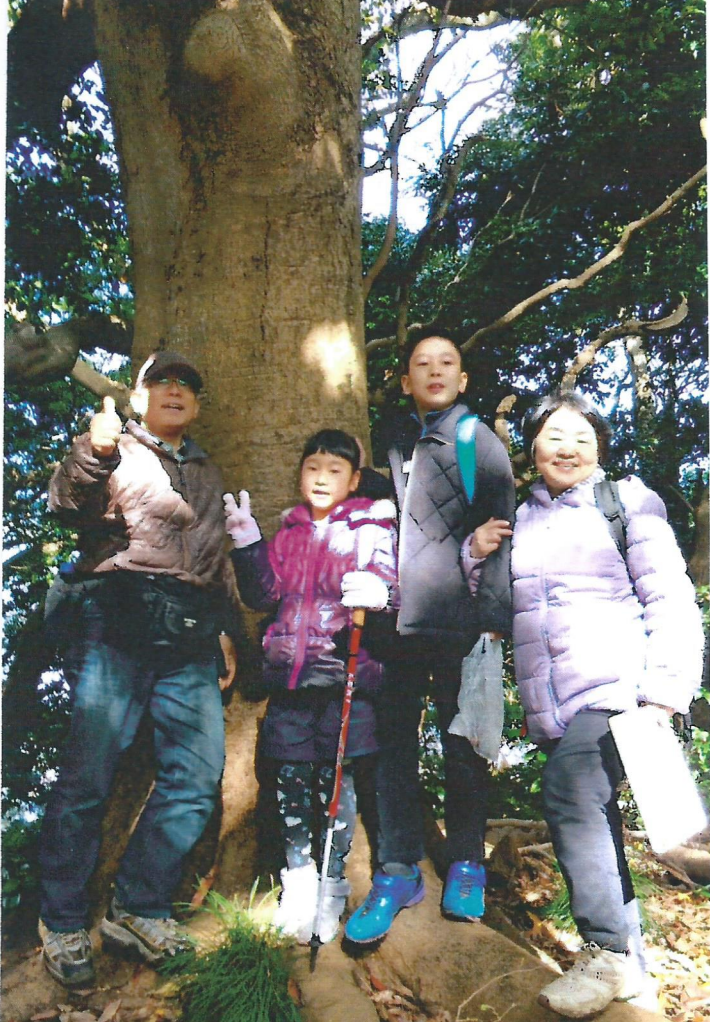
～ 鎮守の森の森見分、タブの木の太木の前で～