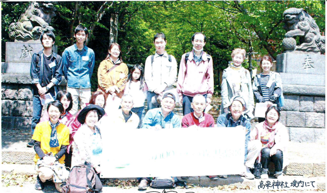
高来神社境内にて